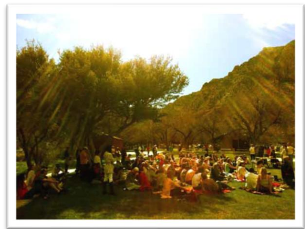
Celebración del primer domingo de abril en Las Vega

Los Elohim nos dieron un Mensaje no solo para explicar de dónde venimos, no solo para explicar por qué estamos aquí, sino para explicar el hermoso paraíso que podemos crear en este planeta si aplicamos sus enseñanzas, que son: destruir todos los poderes.