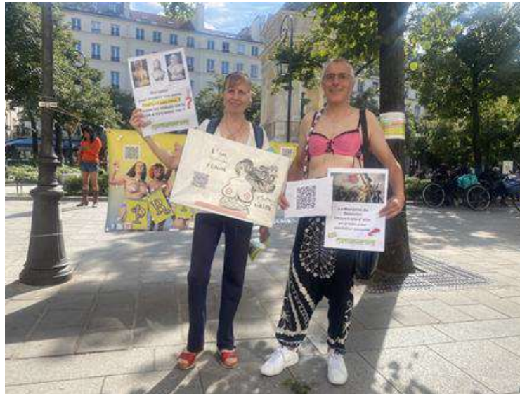
Europa: Francia, Lione e Montauban