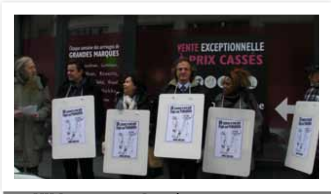
UK-Pope protest in Brussels