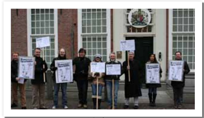
UK-Pope protest in The Hague