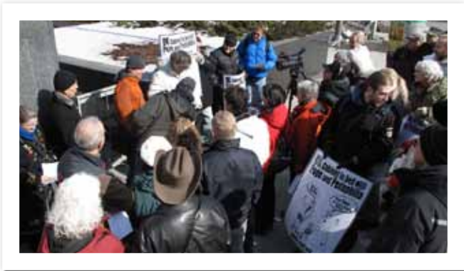
UK-Pope protest in Ottawa