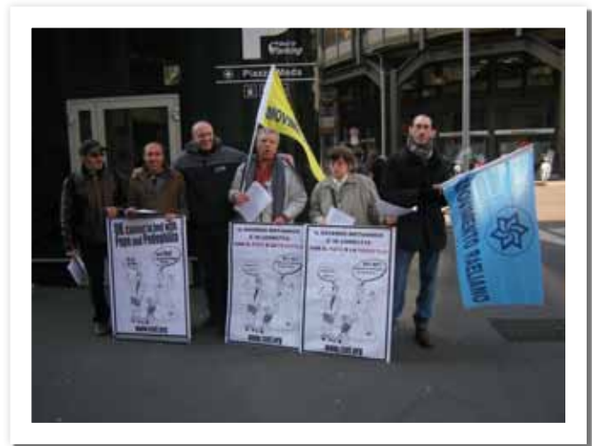
UK-Pope protest in Milan