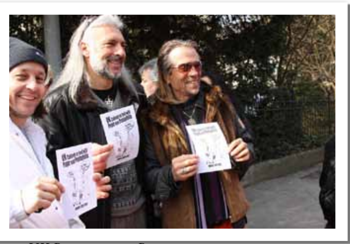
UK-Pope protest in Berne

pris des photos de notre affiche, dont une personne qui avait l'intention de la placer sur Facebook.