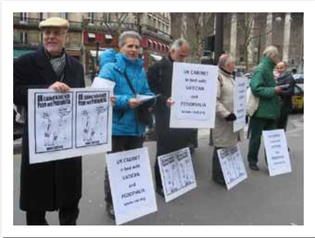
UK-Pope protest in Paris