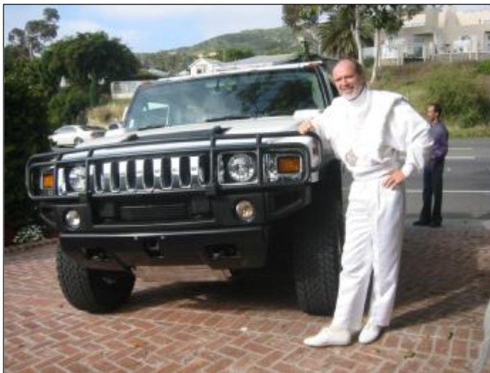
Notre Prophète Bien-Aimé devant le "Hummer" qu'un Raëlien lui a prêté pour la durée de sa visite.

Les croyances... «Je souhaite que personne ne croit. C'est ce que je dis à propos des Messages : lisez, étudiez et comprenez. Plus vous vous posez de questions sur quoique ce soit, plus vous devenez intelligent puisque vous développez votre cerveau en vous questionnant. Les croyances génèrent la haine, la ségrégation, la violence et la guerre. La science génère l'amour. Hitler disait «Gott mit uns» qui signifie «Dieu avec nous». Dieu peut être à l'opposé de l'amour. La science ne le peut jamais.