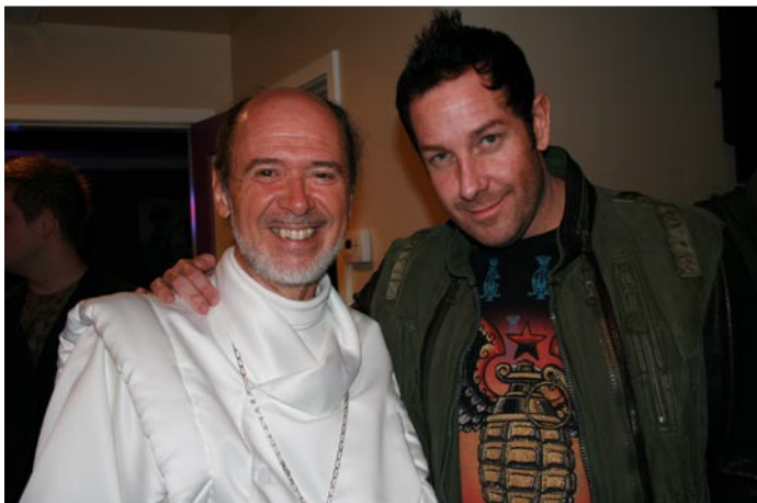
Avec Steve Wyrick, magicien célèbre qui présente un show permanent à Las Vegas

Comme beaucoup d'entre eux étaient dans la salle, il les a encouragés à se souvenir d'où ils viennent et à aider le continent qui a souffert du départ de leurs ancêtres et de la colonisation abusive des blancs. Nous savons tous combien il est délicat pour un blanc de parler à des noirs d'affaires qui les concernent... eh bien, c'est là qu'un Prophète fait la différence:-). La plupart des