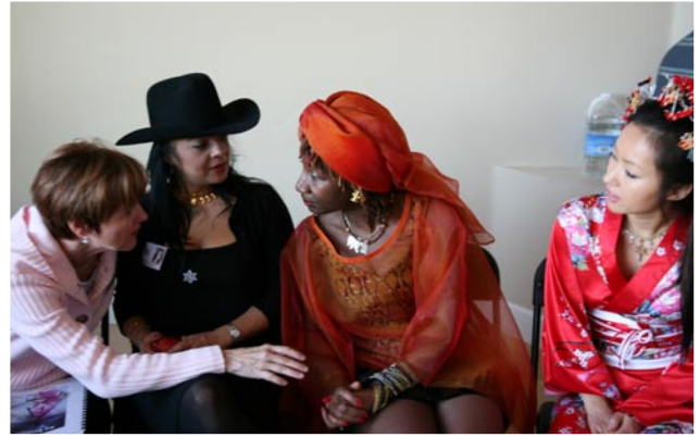
Quatre évêques, quatre continents... quatre femmes incroyablement merveilleuses et uniques...