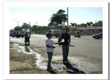
Above and below, diffusion in the Dominican Republic

J'ai de bonnes nouvelles d'ici, d'Amérique du Sud. Les choses ont très bien débuté. Il y a deux mois, il y avait un raélien à Buenos Aires, maintenant, il y en a 4 : un vient de déménager d'Europe, je suis arrivé des USA et nous avons fait notre première transmission depuis des années samedi dernier ! Tous sont trrrrrs excités !!! Nous allons sponsoriser un Love Party dans six semaines, avec des danses et des performances artistiques, avec la solide intention de créer un espace pour l'Amour; et nous avons une conférence de planifiée pour dans dix semaines, où nous espérons rencontrer la presse, avec des powerpoints des quicktimes et du matériel créé expressément pour nous, par nos nouveaux raéliens d'Argentine et d'Uruguay. J'ai hâte !!!!!!!