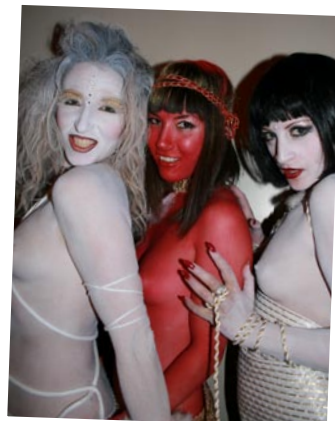
Rael's Angels... :-)