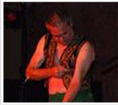
Un très impressionnant piercing durant le spectacle